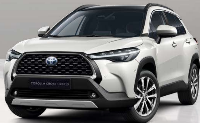
Scelta verniciature monocolori